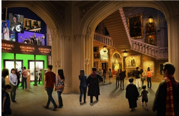
※ワーナー ブラザーススタジオツアー東京 - メイキング・オブ・ハリー・ポッター 動く階段エリア（イメージ）

本施設は 2012 年の開業以来 1600 万人以上が来場し、いまだに予約困難なイギリスの「スタジオツアーロンドン」に次いで世界で2 番目、アジアでは初のオープンとなります。約 9 万平方メートルの広大な敷地（東京ドーム 2 個分）に建つ本施設では、映画でたびたび登場する大広間や、魔法界へと続く 9 と 3/4 番線の Hogwarts 特急、ダイアゴン横丁のほか、Hogwarts の動く階段のエリアでは、肖像画の前で自分たちの姿を撮影すると、実際に動く肖像画になれるようなインタラクティブな体験もお楽しみいただけます。なお、この施設は、事前予約制です。映画「ハリー・ポッター」や「ファンタスティック・ビースト」シリーズの世界を、自分にあったスタイルでゆっくり回りながら、これまでに体験したことがない魔法ワールドの世界観をぜひご期待ください。